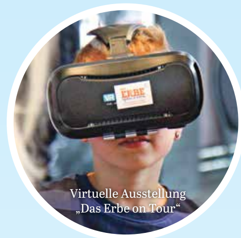
Virtuelle Ausstellung „Das Erbe on Tour“