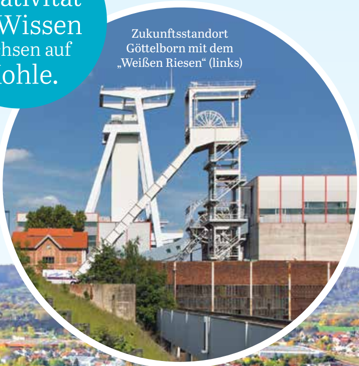
Zukunftsstandort Göttelborn mit dem „Weißen Riesen“ (links)

Ideen, Kreativität und Wissen wachsen auf Kohle.