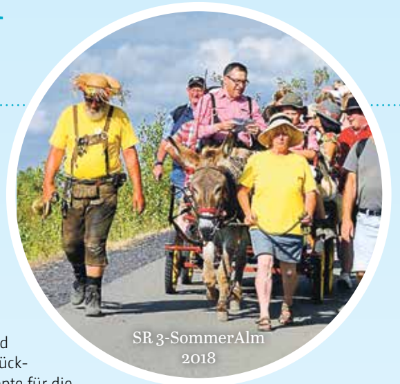
SR 3-SommerAlm 2018

Ein Seerosenbecken, ein Sumpfpfyzypressenwald, der Mosesgang: Nein, Sie sind nicht plötzlich in eine exotische Kulisse am anderen Ende der Welt gebeamt worden, Sie befinden sich in den Wassergärten Reden . Bergbau heißt auch immer: Wasser. Grubenwasser, Regenwasser, heißes Wasser, kaltes Wasser. Hier, in beeindruckender Umgebung, erleben Sie Wasser einmal ganz anders als aus dem Wasserhahn oder an der Ostsee. Übrigens: Alle zwei Jahre