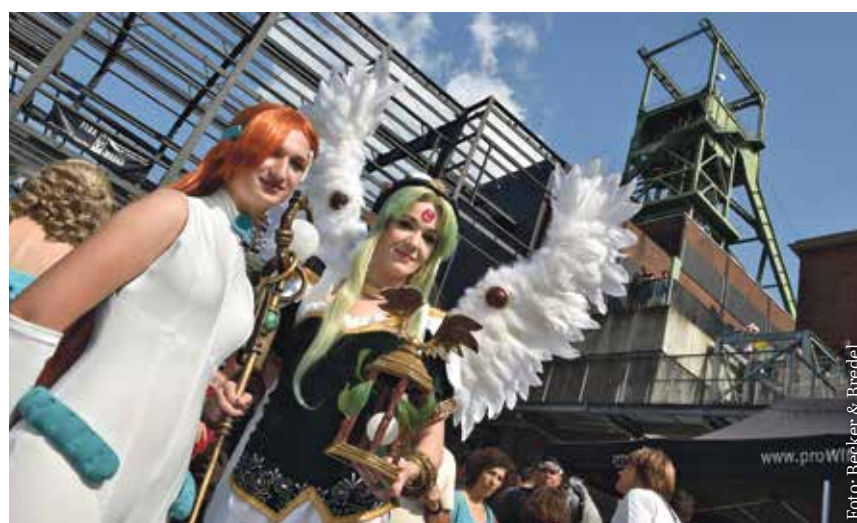
Industrielle Anlagen haben viel zu bieten: Hier dient die Grube Reden als Veranstaltungsort für das Fantasie- und Rollenspiel-Konvent FaRK.

kels der Großregion, die das gemeinsame industriekulturelle Erbe in die Mitte Europas befördert und mithilfe von europäischen Förderanträgen das Potenzial zutage fördert. So bietet die Industriekultur vielfältige Chancen, das in seiner Sanierung, seinem Unterhalt, seiner Vermittlung erworbene Know-how für Lehre, Forschung und Start-ups zu nutzen. Beispielsweise habe ich vor drei Jahren gemeinsam mit Partnern aus allen Teilen der Großregion eine Schule der Industriekultur vorgeschlagen, finanziert über die EU.