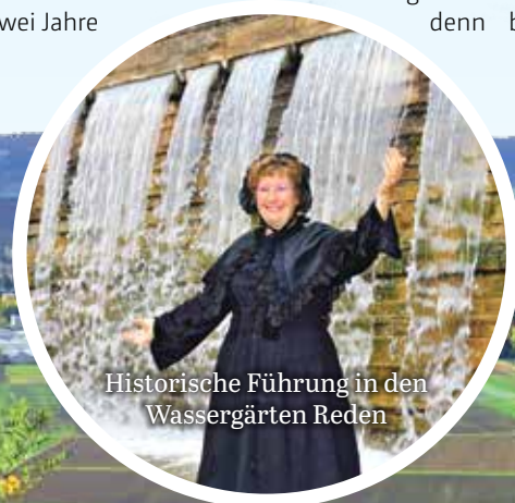
Historische Führung in den Wassergärten Reden

Geben Sie es zu: Schon bei der Führung auf die Halde dachten Sie heimlich an Bayerns schöne Berge. Können Sie haben! Die Bergehalde ist nämlich jedes Jahr zehn Tage lang Schauplatz für die „ SR 3-SommerAlm “. Und wenn der Berg ruft, dann pilgern mehr als 30.000 Besucher, meist in Dirndl und Lederhosen, zur Bergmanns Alm, um droben zu deftiger Musik typische Schmankerl und spektakuläre Ausblicke zu genießen. Und das Schönste: Man spricht Hochdeutsch! Also, jedenfalls beinah ... auch beim Tropical Mountain Festival und der Mega-Sommerparty „La Fiesta“, denn beide Events fin-