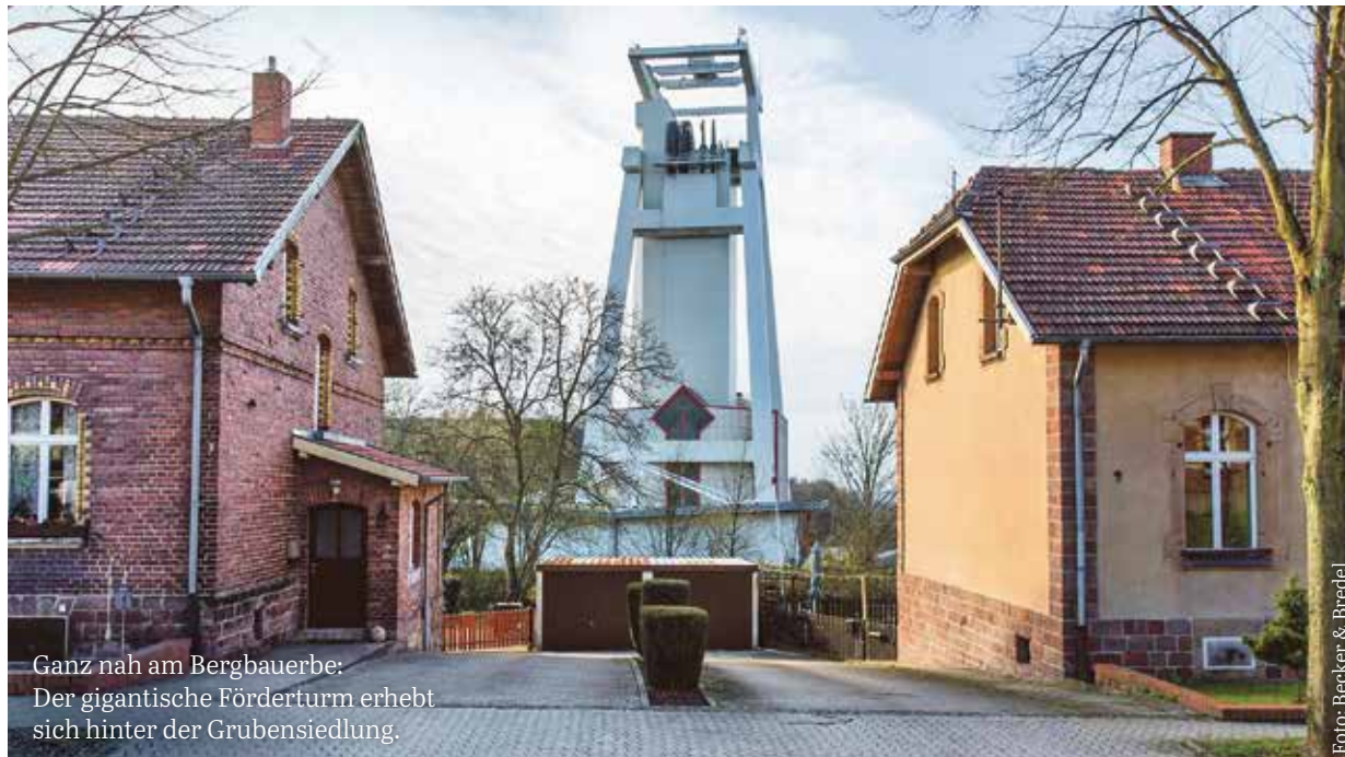
Ganz nah am Bergbauerbe: Der gigantische Förderturm erhebt sich hinter der Grubensiedlung.